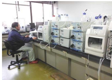
イオンクロマトグラフ