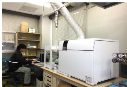
誘導結合プラズマ質量分析計

今後とも水道利用者の皆様の水道水質への期待に応じていくよう、より安全でおいしい水づくりに取り組んでいきます。