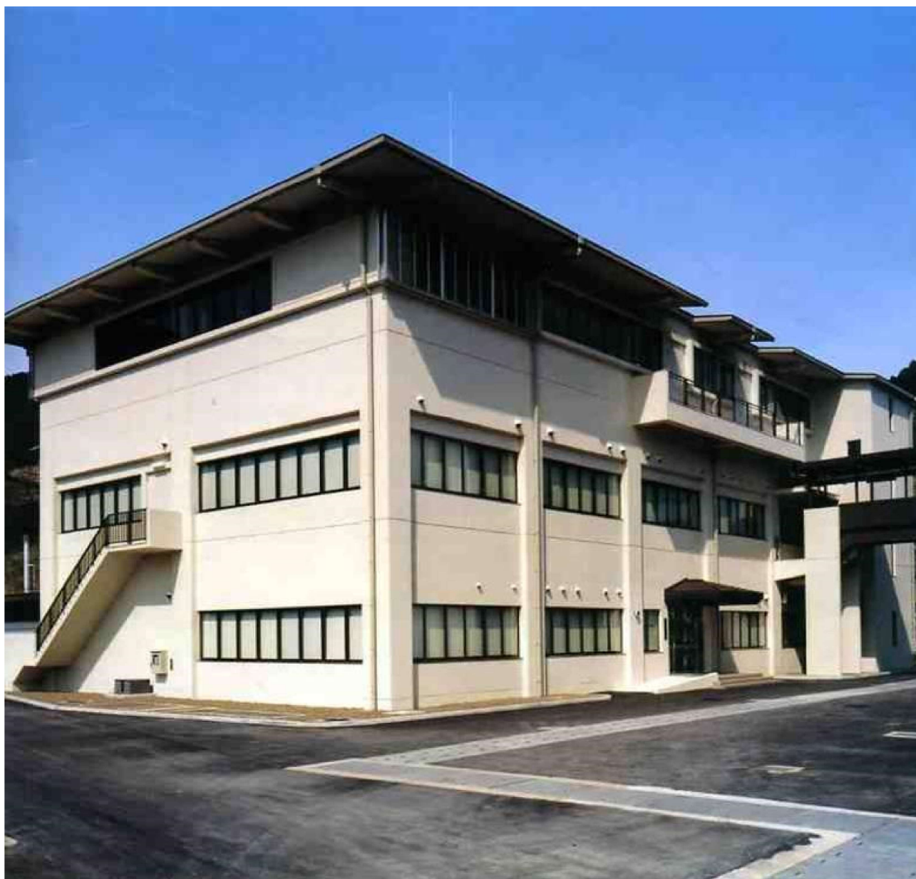
水質管理センター